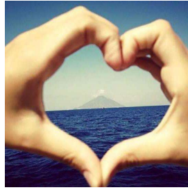
Pro Loco Amo Stromboli